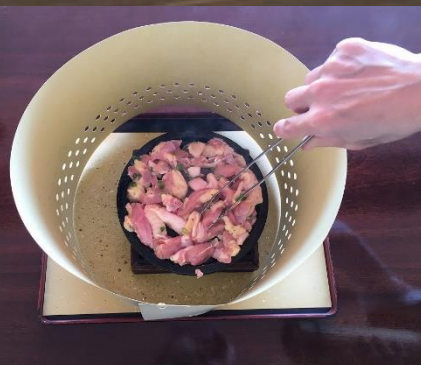
④お肉をすべて板の上に置く。遠慮せずに置いてください。