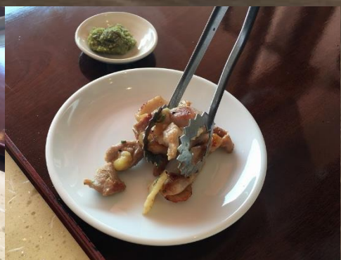
⑨完成です☆ 柚子胡椒、しんなりキャベツと一緒にご賞味ください！