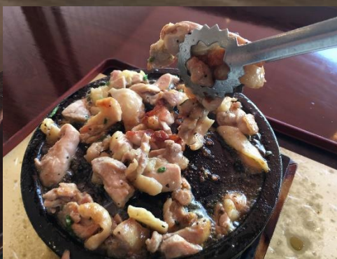
⑧お好みで焦げ目をつければ・・・