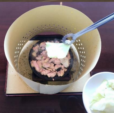
⑥キャベツがしんなりしてきたら、取り皿にすべて取り出す。