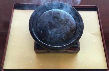
②お肉、柚子胡椒をお盆の外に出し、石焼板を真ん中にセット。石焼板はかなり熱いので、ご注意を！！