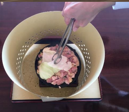
⑤お肉の上にフタをするように、キャベツをしきつめる。