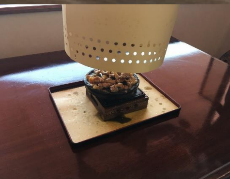
⑦グリルカバーを外す。油の飛びはねにご注意を！